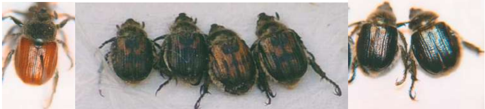
Fig. 3. Distintas formas cromáticas de Anisoplia remota Reitter, 1889.

Como otras especies del género, Anisoplia remota tiene varias formas cromáticas, y en los individuos menorquines, aparte del color corporal negro, en los élitros presenta varios tipos de coloración, desde la forma típica pardo amarillenta (alrededor del 65% de los ejemplares capturados), a los élitros negros, de intensidad a veces algo reducida, probablemente en ejemplares juveniles, (el 10 % del total), que constituye la ab. funerea Muls., y la también negra con una gran mancha arqueada amarilla, común, en