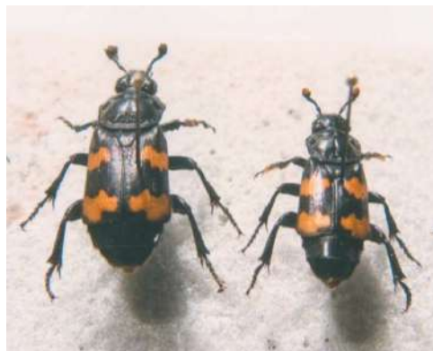
Fig. 1. Nicrophorus interruptus Stephens, 1830.

Aunque la especie cuenta con numerosas variedades cromáticas (Portevin, 1926; Báguena, 1965), los ejemplares menorquines que he visto (Compte), son re-